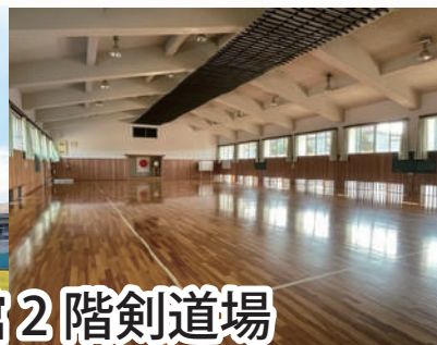
犬山市武道館 2階剣道場