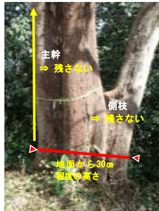
部分伐採イメージ

伐り口は可能な限り平滑にし、斜面下側にやや傾斜させることで、雨水の滞留とそれに伴う切断面の腐朽の進行を遅らせます。抜根は行いません。