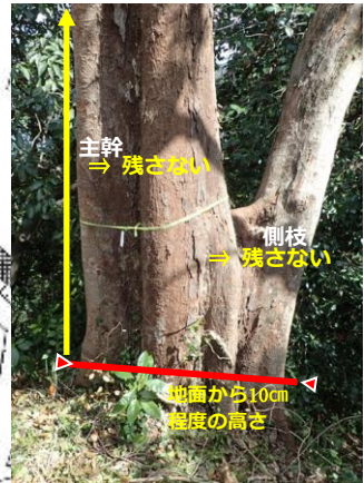
完全伐採イメージ