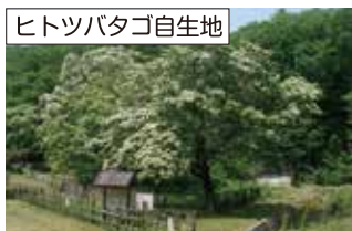
日本に5カ所しかない自生地は国の天然記念物で、5月には樹高10mを超す大木全体に真っ白い花が咲き、まるで雪が降り積もったようになります。