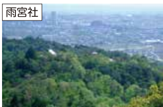
雨宮社からは、眼下に小牧市桃花台ニュータウンの街並みを望み、天候が良ければ名古屋駅前高層ビル群も見るすることができます。