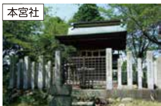
標高293mの本宮山の頂に鎮座する大縣神社奥宮(本宮社)。山頂からは濃尾平野を一望することができます。