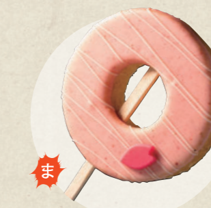
縁バウム (苺) 500円

たて輪 犬山店 ☎ 070-2318-3339 ☎ 8:00~17:00、水・木曜定休