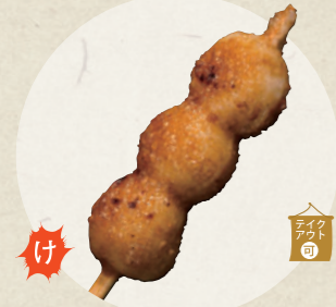
五平餅 (だんご型) 100円

伊勢屋 砂おろし ☎ 0568-61-5502 ☎ 10:00~17:00 第2・4金曜定休(祝日は営業)