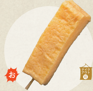
スープまどうまい!だし巻たまご 300円 串わらび (きな粉) 600円

昭和横丁 恋小町だんご ☎ 0568-65-6839 ☎ 11:00~17:00、火曜・第3水曜定休