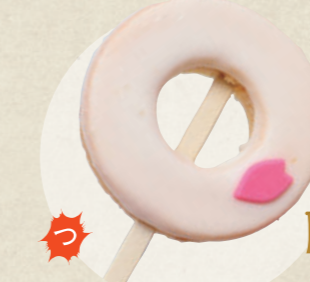
縁バウム (檸檬) 500円

和雜貨&和カフェ むすび茶屋 ☎ 0568-48-7870 ☎ 11:00~17:00 火曜定休