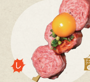
特上飛騨牛 すきやき串 1,200円

クンカツとなる ☎ 0568-65-0880 ☎ 10:30~17:00、期間中無休