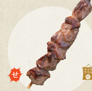
イチボステーキ串 700円

りんご専門店 AERI ☎ 0568-58-8788 ☎ 10:00~17:00、水曜定休