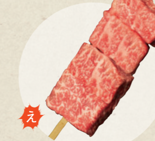
飛騨牛ランプステーキ串 1,000円

犬山本丸スクエア うし若丸 本丸店 ☎ 090-8133-2001 ☎ 10:30~17:00、期間中無休