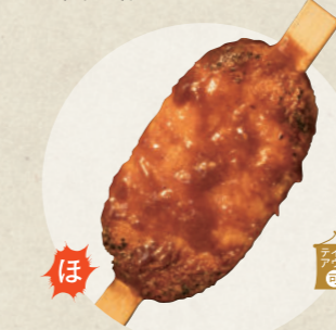
手作りくるみだれ五平餅 250円

プライドキッチントリノ ☎ 0568-39-5977 ☎ 11:00~14:00、16:30~19:00 (L.O.昼夜共通で営業15分前)、水曜定休