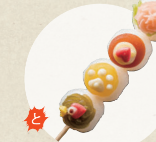
犬山ももたろう小町 380円

町家処 どんでん ☎ 0568-62-5543 ☎ 11:00~16:00、火・水曜定休