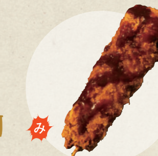
五福屋乃串かつ 350円

ココモベリー-犬山店 ☎ 0568-54-4717 ☎ 10:00~19:00、期間中無休