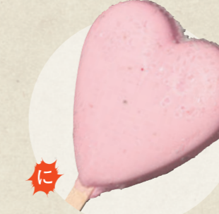
恋みくじ愛す(恋みくじ付き) 450円

昭和横丁 うま家 ☎ 090-5623-9159 ☎ 11:00~17:00(平日~16:00) 金曜定休