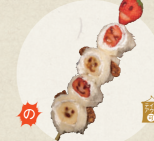
フルーツロール串 500円

飛騨牛串専門店 蘭丸 ☎ 090-3872-4942 ☎ 10:00~17:00、無休