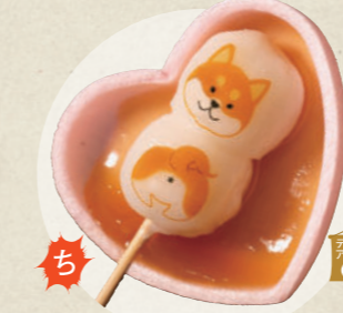
みたら柴だんご 300円

犬山本丸スクエア 肉工房 美乃家 ☎ 090-3565-0351 ☎ 10:00~17:00 年中無休