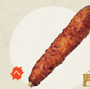
名古屋コーチンつくね串 280円

森のマルシェ Passport ☎ 090-6380-8810 ☎ 10:30~16:30、木曜定休