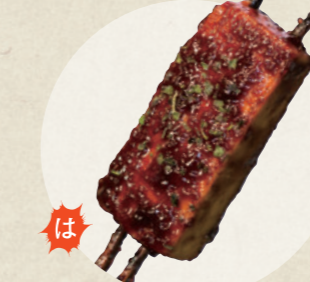
松野屋でんがく 690円(8本)

Inuyama 975cafe ☎ 0568-54-4890 ☎ 9:00~17:00(平日は~15:00) 火曜・第3水曜定休