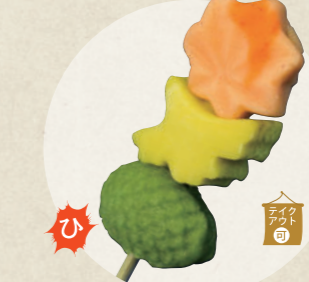
紅葉のかんざし 300円

でんがくの 松野屋 ※店内飲食のみ ☎ 0568-61-2417 ☎ 11:00~15:00(L.O.14:30) 木曜定休