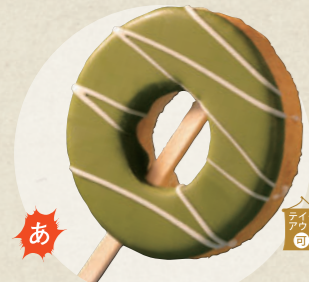
縁バウム (西尾抹茶) 600円

明治時代から伝わる郷土料理の「でんがく」をはじめ、 伝統的な串料理から意表をついた新たな串グルメまで、様々な串物が集う犬山。 城下町の「串物」を次々と食べて、「串物の町 犬山」を存分に味わおう!