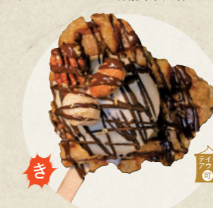
アイスチョコナッツゴールド 650円

犬山本丸スクエア ももたろう ☎ 080-5159-2869 ☎ 10:00~17:00、期間中無休 年中無休