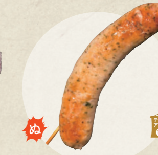
ブラートヴルストフランク 350円

昭和横丁 七福亭 あぎな ☎ 0568-62-6662 ☎ 11:00~17:00、金曜定休